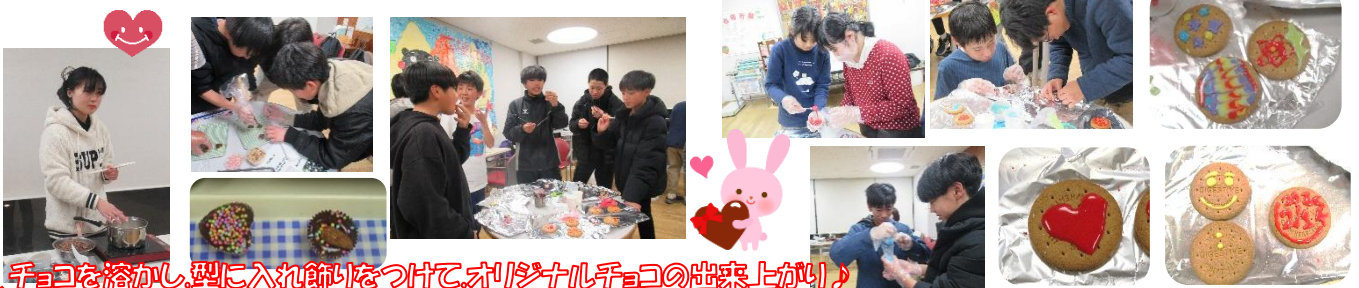
チョコを溶かし、型に入れ飾りをつけて、オリジナルチョコの出来上がり!