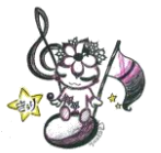
きりちゃん ミニづかキャラクター

主催：第18回ミニたからづか実行委員会・宝塚市・宝塚市児童館ネットワーク会議・地域関係者・子ども関係団体・宝塚市社会福祉協議会