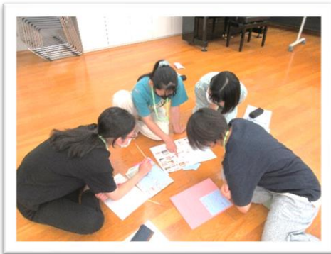
グループで意見を出し合っています。