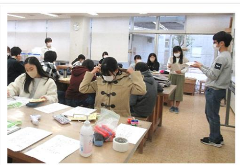
最終確認。みんなで共有！