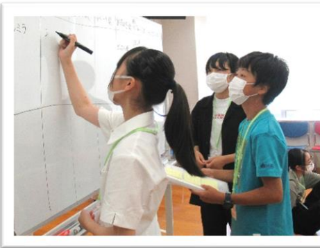
出た意見をまとめています。