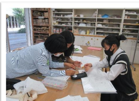
もうすぐ本番！熱も入ります！