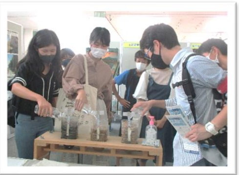
『人と防災未来センター』へ見学に行き、内容を本番に活かしました。