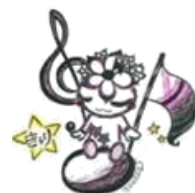
ミニたからづかキャラクター 「きらりちゃん」

ドイツのミュンヘン市で行われている「ミニ・ミュンヘン」をモデルにした、子どもがつくるまち「ミニたからづか」を開催します。